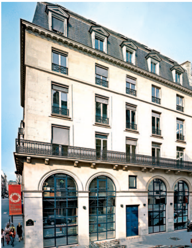
12, rue de la Bourse • Paris 2 ème